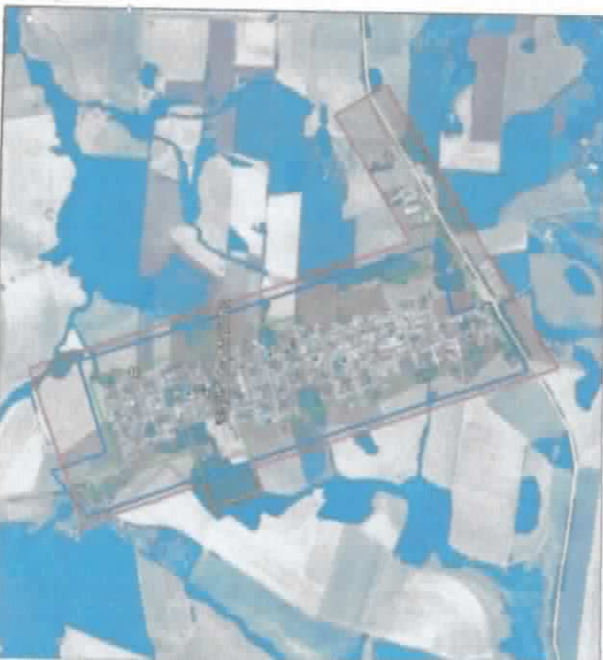
Imagem Aérea da Ampliação do Perímetro Urbano da Cidade de Saldanha Marinho / RS - Com Área Total: 3.084.892,08 m 2